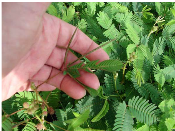
Mimosa pudica réagissant au toucher