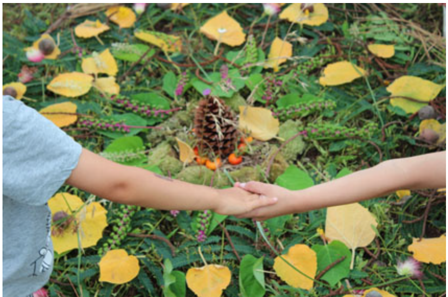
Confection d'un mesclun après la cueillette, et avant dégustation. Land art dans un esprit de coopération. 2017