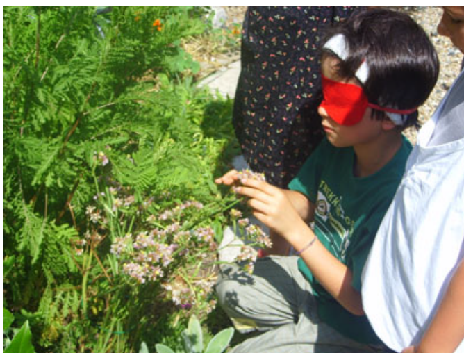
Jeu de Kim